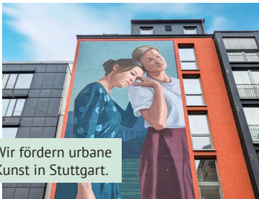
Wir fördern urbane Kunst in Stuttgart.