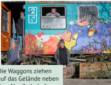
Die Waggon ziehen auf das Gelände neben dem Nordbahnhof.