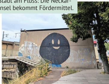
Stadt am Fluss: Die Neckarinsel bekommt Fördermittel.