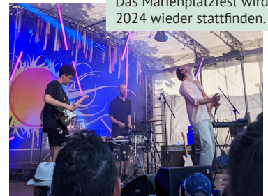
Das Marienplatzfest wird 2024 wieder stattfinden.