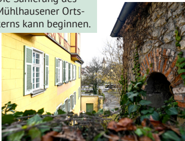
Die Sanierung des Mühlhausener Ortskerns kann beginnen.