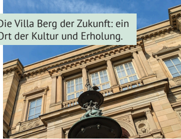
Die Villa Berg der Zukunft: ein Ort der Kultur und Erholung.