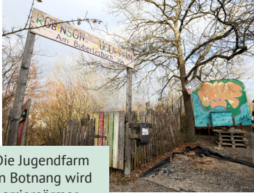
Die Jugendfarm in Botnang wird barriereärmer.