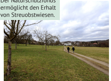
Der Naturschutzfonds ermöglicht den Erhalt von Streuobstwiesen.