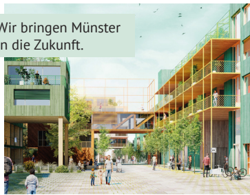
Wir bringen Münster in die Zukunft.