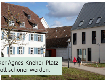
Der Agnes-Kneher-Platz soll schöner werden.