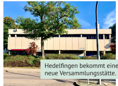
Hedelfingen bekommt eine neue Versammlungsstätte.