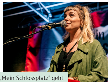
„Mein Schlossplatz“ geht in die Verlängerung.