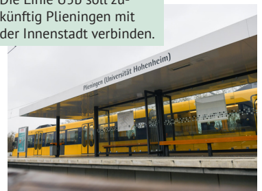
Die Linie U5b soll zukünftig Plieningen mit der Innenstadt verbinden.