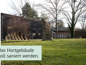
Das Hortgebäude soll saniert werden.