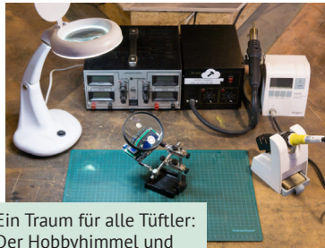
Ein Traum für alle Tüftler: Der Hobbyhimmel und seine offene Werkstatt.