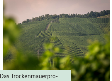
Das Trockenmauerprogramm kann weitergehen.