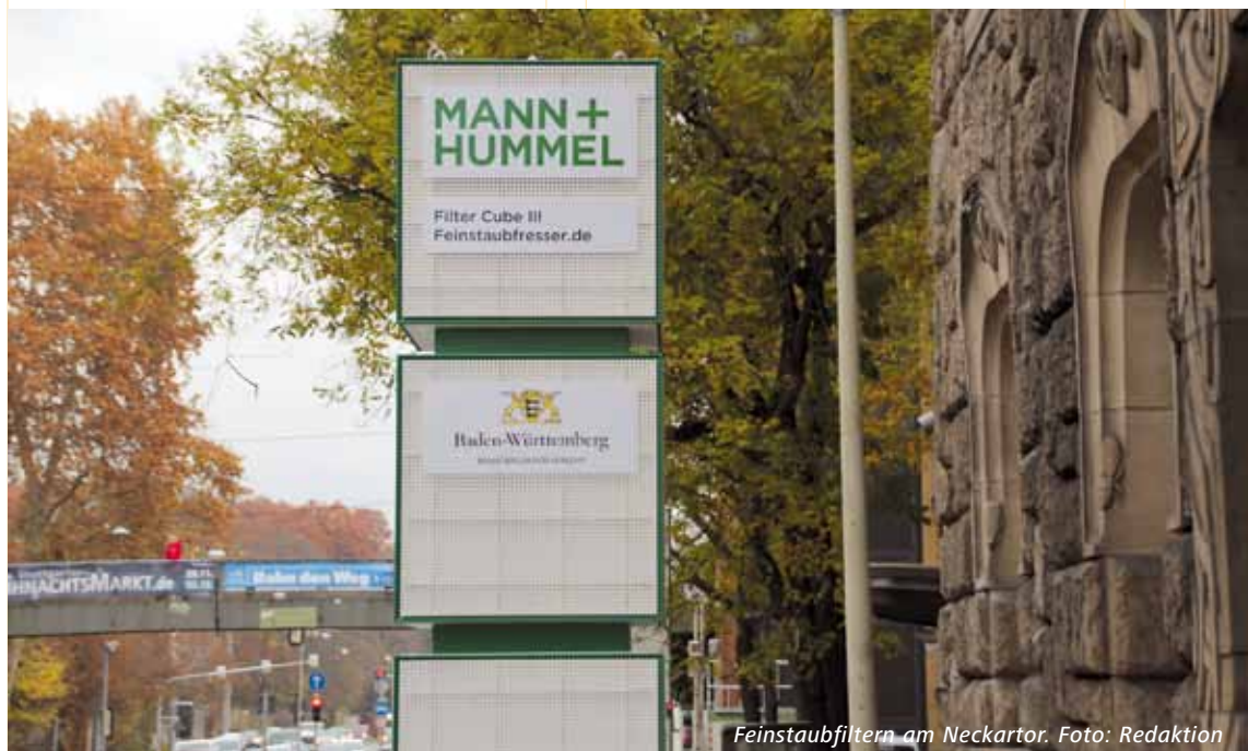
Feinstaubfiltern am Neckartor. Foto: Redaktion

AUCH WEGEN MERKEL: FAHRVERBOT IST ALTERNATIVLOS. | Allen Anstrengungen zum Trotz sind Fahrbeschränkungen für Euro-4-Diesel ab dem 1. Januar 2019 nicht mehr zu vermeiden, da seitens der Emissionserzeuger und der Bundesregierung zu wenig getan worden ist. Statt aus dem Diesel-Skandal vor drei Jahren zu lernen und die Fahrzeuge, die im Realbetrieb mehr Schadstoffe ausstoßen als erlaubt sind, nachrüsten zu lassen, war der Bund viel zu lange untätig. Weder die sofort wirksamen Software-Nachrüstungen hat man von den Herstellern eingefordert, noch wurde der gesetzliche Rahmen geschaffen, um die Euro-5-Flotte durch Hardware-Nachrüstungen deutlich sauberer zu machen. Unser Appell ist klar: Nachdem die Euro-4-Diesel nun als Folge der Untätigkeit nicht mehr gerettet werden können, muss der Bund jetzt Lösungen für Euro-5-Fahrzeuge liefern. Denn nur noch so lassen sich Fahrbeschränkungen für die Besitzer von Euro-5-Fahrzeugen vermeiden.