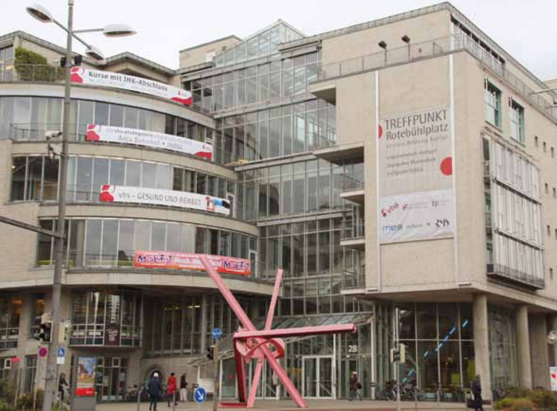
Treffpunkt, ziemlich eingeschnürt.