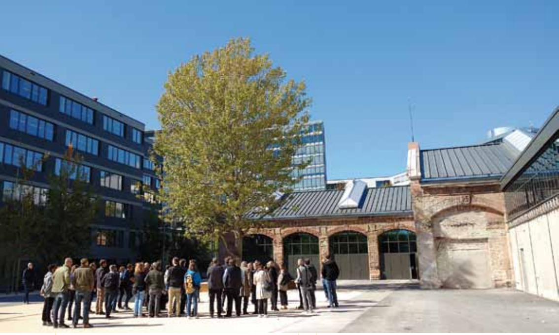
Besichtigung der renovierten Hallen.