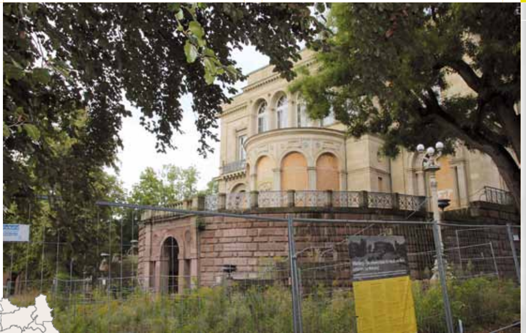
2023 soll der Umbau der Villa Berg abgeschlossen sein.