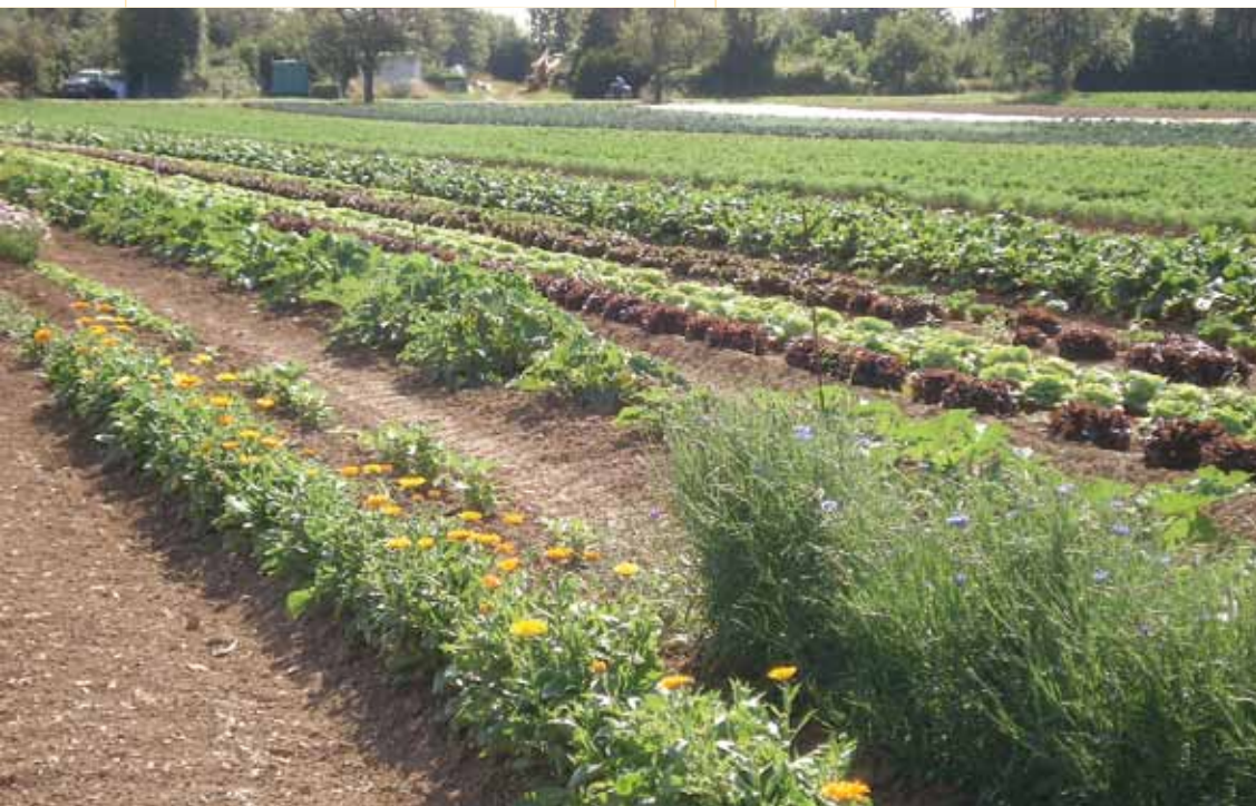
Stuttgarts Bauern unter Druck: Auf ihren Äckern will ein Teil des Gemeinderats Wohnungen bauen lassen.