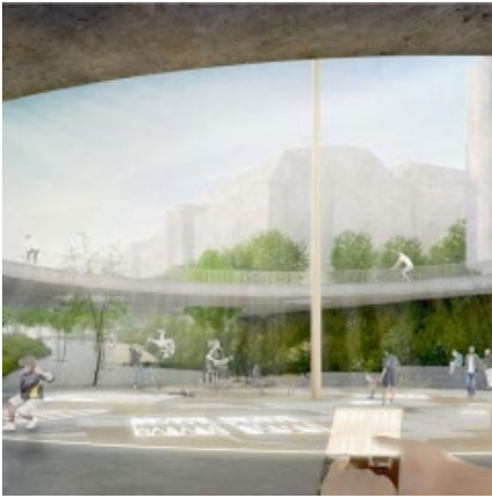
(Skizze: asp Architekten GmbH & Köber Landschaftsarchitektur GmbH)

Noch in der vergangenen Wahlperiode haben wir gemeinsam mit den progressiven Kräften im Rat den ‚Zielbeschluss lebenswerte Innenstadt‘ gefasst. Ein zentraler Baustein ist mehr Platz für Menschen. Dieses Ziel wird nun konkret: im Sommer haben wir zusätzliche Fußgängerzonen beschlossen - und am 15.09. ging ein zukunftsweisender Wettbewerb zur B14 an den Start. Rausgekommen ist ein toller Plan für diese zentrale Innenstadtachse. Mehr dazu >> hier